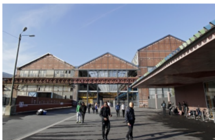
(M. Libert – 20 minutes)

Le site industriel de FCB – Fives Cail Babcock situé dans le quartier de Fives sur la commune de Lille a fait l'objet d'une réhabilitation depuis 2012 après une période de friche de 10 années.