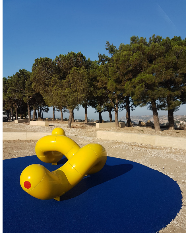
Premières réalisations du belvédère Canova