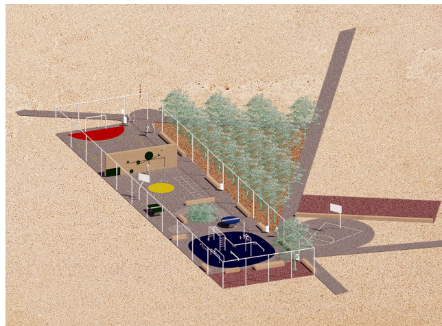
Axonométrie pôle multisports

Cette traduction opérationnelle d'une réflexion, qui pouvait paraître utopique, est associée à deux autres opérations presque concomitantes et tout aussi novatrices : le Belvédère Canova et le Monticole.