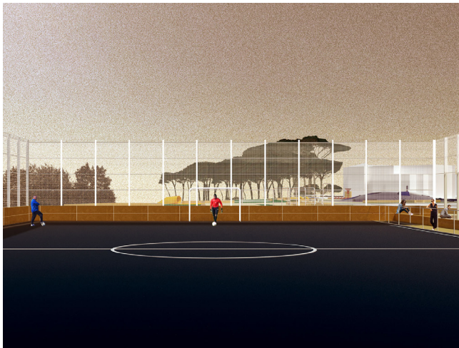
L'insertion du terrain de jeu dans le Belvédère Canova