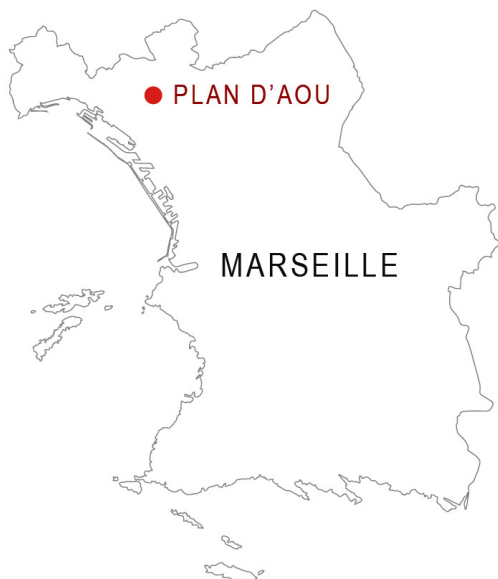
Plan de localisation © Conseil Urbain / Agam