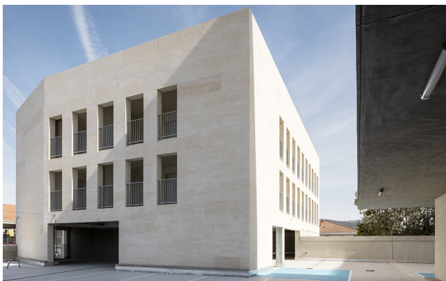
Le stationnement au R+1 et les plots de logements en pierre naturelle © Land architectes + BAG