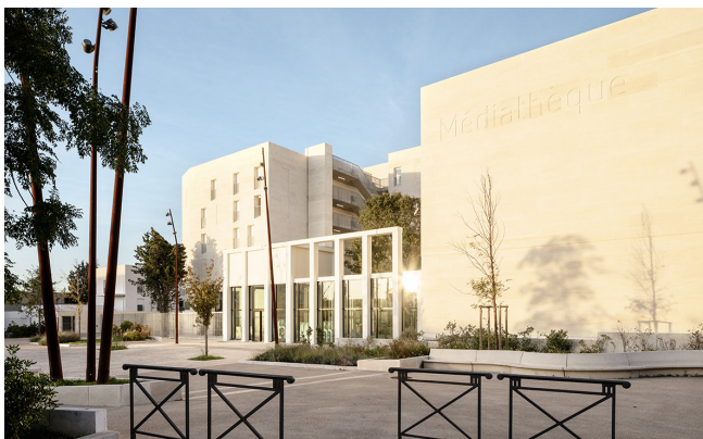
Façade du programme Monticole - Bibliothèque, restaurant, centre de santé, logements © Land architectes + BAG / Photo : Philippe Conti