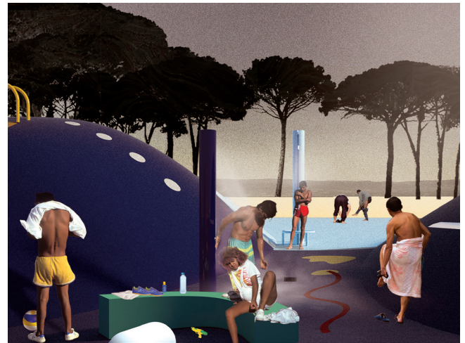
Lune Bleue et Belvédère