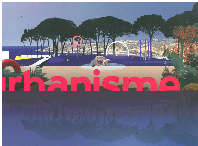
Vue depuis le Belvédère vers la cote bleue, couverture revue Urbanisme