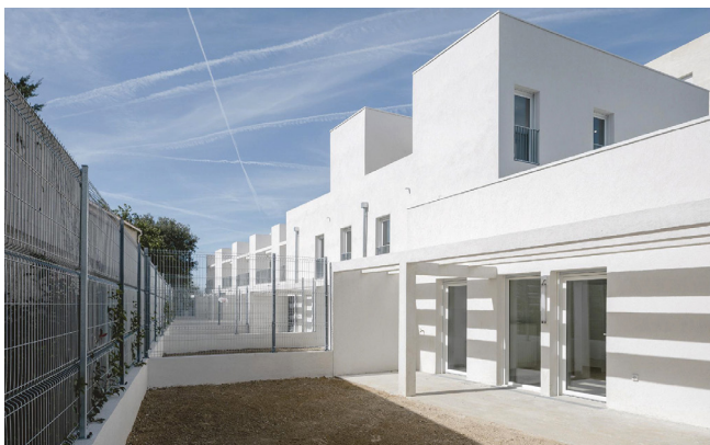
Les logements individuels exposés sud © Land architectes + BAG