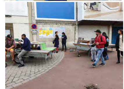
Échelle du voisinage

3 échelles de constats et d'enjeux programmatiques pour le jardin