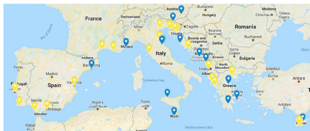
Fig: Maps showing the cities targeted for which information was gathered (in yellow) and other cities targeted.