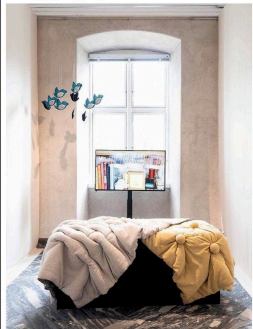
BJORN BERTHEUSEN | VISIT COPENHAGEN