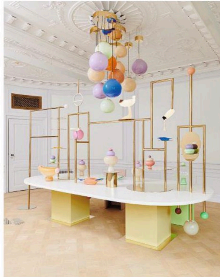
Le show-room de l'artiste Helle Mardahl où elle expose ses créations colorées en verre soufflé.